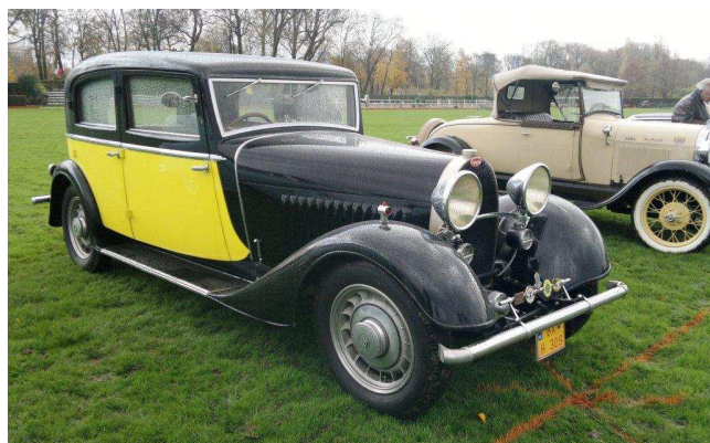
Bugatti ze Slovenska se zúčastnila nedělní jízdy Paříží