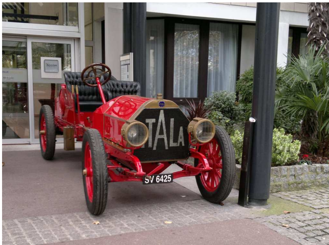
Itala před hotelem, ve kterém probíhala jednání FIVA