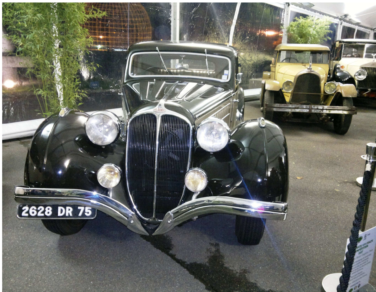
Majestátní Delahaye na výstavě historických vozidel v pařížském sídle UNESCO