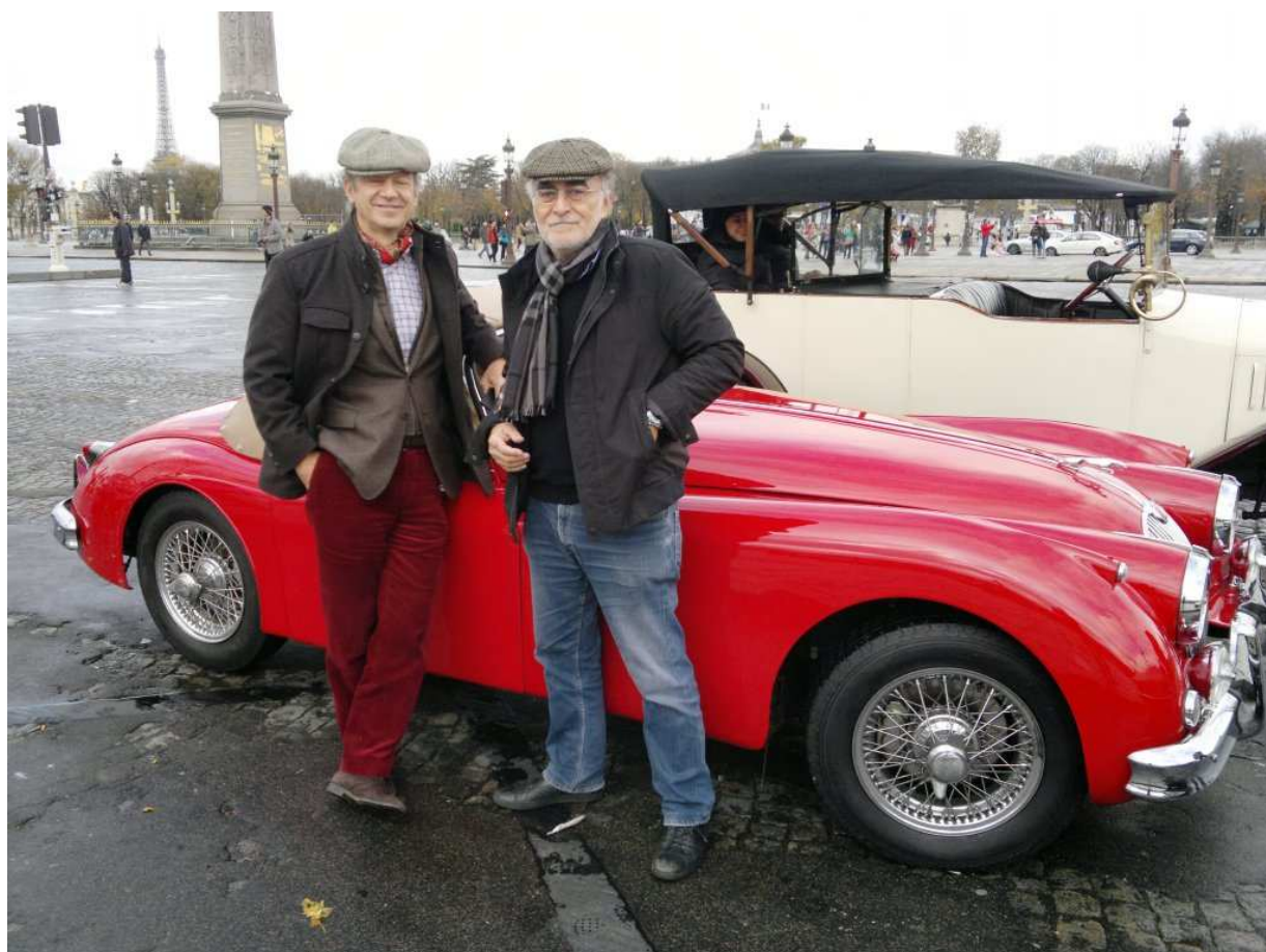
Rony Karam (vpravo) na pařížském náměstí Concorde